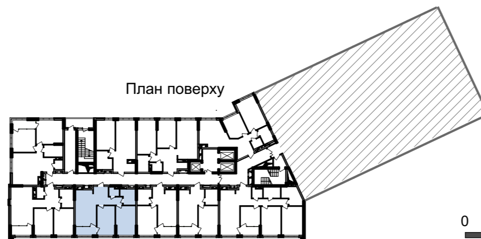
План квартири без перегородок