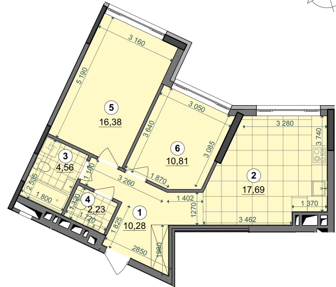
План квартири без перегородок