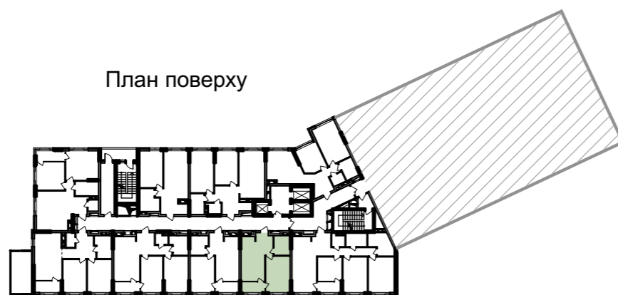
План квартири без перегородок