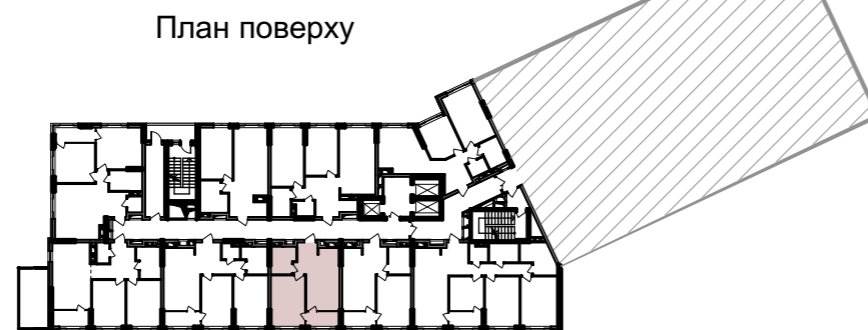
План квартири без перегородок